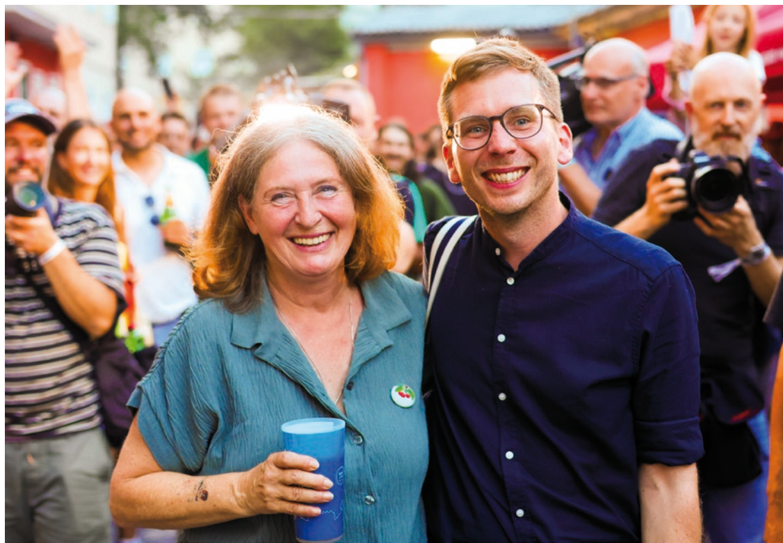
Elke Kahr konnte sich über einen schönen Wahlerfolg in der Landeshauptstadt freuen.