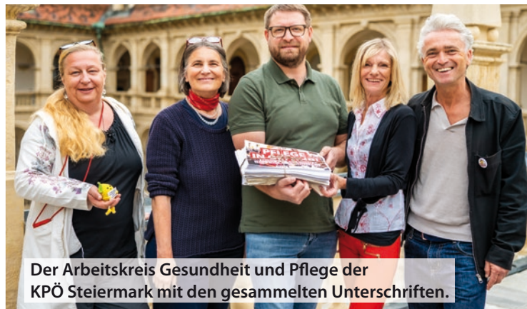
Der Arbeitskreis Gesundheit und Pflege der KPÖ Steiermark mit den gesammelten Unterschriften.

Wird dieser Kurs fortgesetzt, werden zunehmend Dinge verschwinden, die in unserem Land eigentlich eine Selbstverständlichkeit sein sollten: Ein gutes Angebot für unsere Kinder, eine breite Vereinslandschaft mit sportlichen und kulturellen Angeboten, eine soziale Absicherung für alle Menschen und eine gut erreichbare Gesundheitsversorgung.