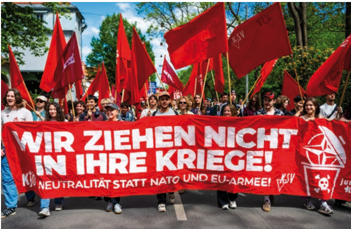
Die KPÖ demonstrierte am 1. Mai für Frieden und Fortschritt.

der Zonen beschäftigen soll. Nun wird auch das jahrelang versprochene Parkraumkonzept endlich vorgelegt. Die KPÖ fordert die erste halbe Stunde in der Blauen Zone gratis zu machen und in der Grünen Zone die Flächen in der Gösser Straße und in der Mallinger Siedlung zurückzunehmen.