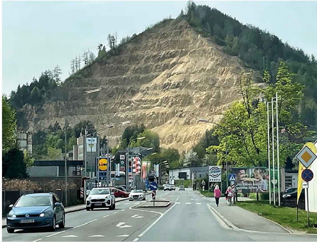
Der Steinbruch prägt das Ortsbild von Oberleitendorf seit Jahrzehnten.

zu Steinschlägen im Nahbereich von Wohnhäusern. Besonders diskutiert wurde ein Vorfall aus dem Jahr 2021, bei dem nach Angaben der Anrainer zahlreiche Gesteinsbrocken in das Wohngebiet gelangten.