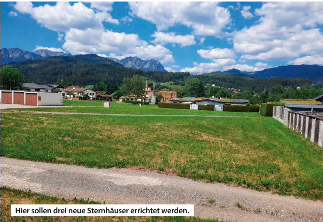
Hier sollen drei neue Sternhäuser errichtet werden.

Für ein Fotostudio in der Hauptstraße und ein Radgeschäft in der Luchinettigasse wurde ein Mietenzuschuß von je 4.800 Euro gewährt. Das wurde einstimmig beschlossen.