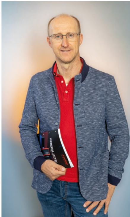
Harald Fink Fink-Installationen GmbH

Auf unserer Homepage finden Sie verschiedene Kontaktformulare für unterschiedliche Beratungsvarianten. So können Sie ganz einfach die für Sie passende Möglichkeit wählen – egal, ob Sie langfristig planen oder kurzfristig handeln müssen,