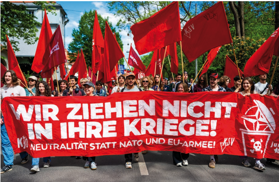
Die KPÖ demonstrierte am 1. Mai für Frieden und Fortschritt.