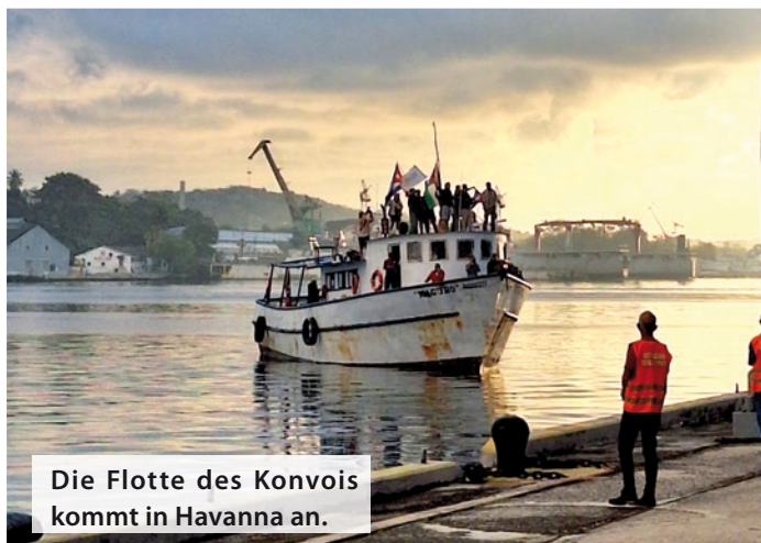
Die Flotte des Konvois kommt in Havanna an.

beeinflusst jeden Bereich des Alltags enorm. Trotzdem wird alles dafür getan, um eine gute Versorgung für die Bevölkerung sicherzustellen. Dieses Durchhaltevermögen wurde auch beim Besuch eines medizinischen Forschungszentrums spürbar. Trotz geringer Ressourcen wird geforscht, Impfstoff entwickelt, weitergearbeitet – weil die Regierung bewusst Schwerpunkte im Sinne der Bevölkerung setzt.