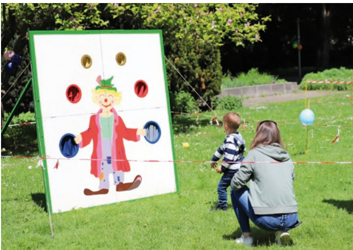
Das Leobener Spielefest findet am 9. Mai im Glacispark statt. Alle sind herzlich willkommen.

kinderland Steiermark www.kinderland-steiermark.at