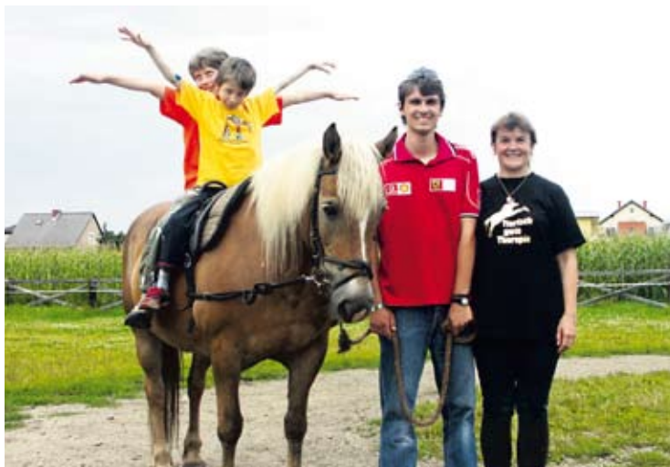
Hippotherapie: Der Nutzen ist weltweit anerkannt. Trotzdem wurde in der Steiermark die Finanzierung gestrichen.