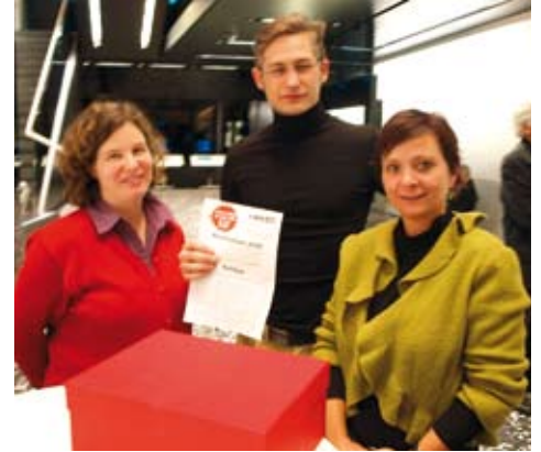
Anti-Privilegierte Partei: KPÖ für mehr soziale Gerechtigkeit

Klimt-Weithaler bekräftigt auch die Forderung nach einer Wahlkampfkostenbeschränkung, für die die KPÖ auch im Landtag geworben hat. Das würde den Menschen mehr bringen als die Verschiebung von Parteivermögen von einem Finanzkonstrukt in ein anderes.