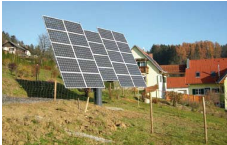
Vom Vorreiter in Sachen Umwelt- und Klimaschutz hat sich Österreich in wenigen Jahren zum Nachzügler entwickelt. Höchste Zeit, dass alternative Energien besser gefördert werden.