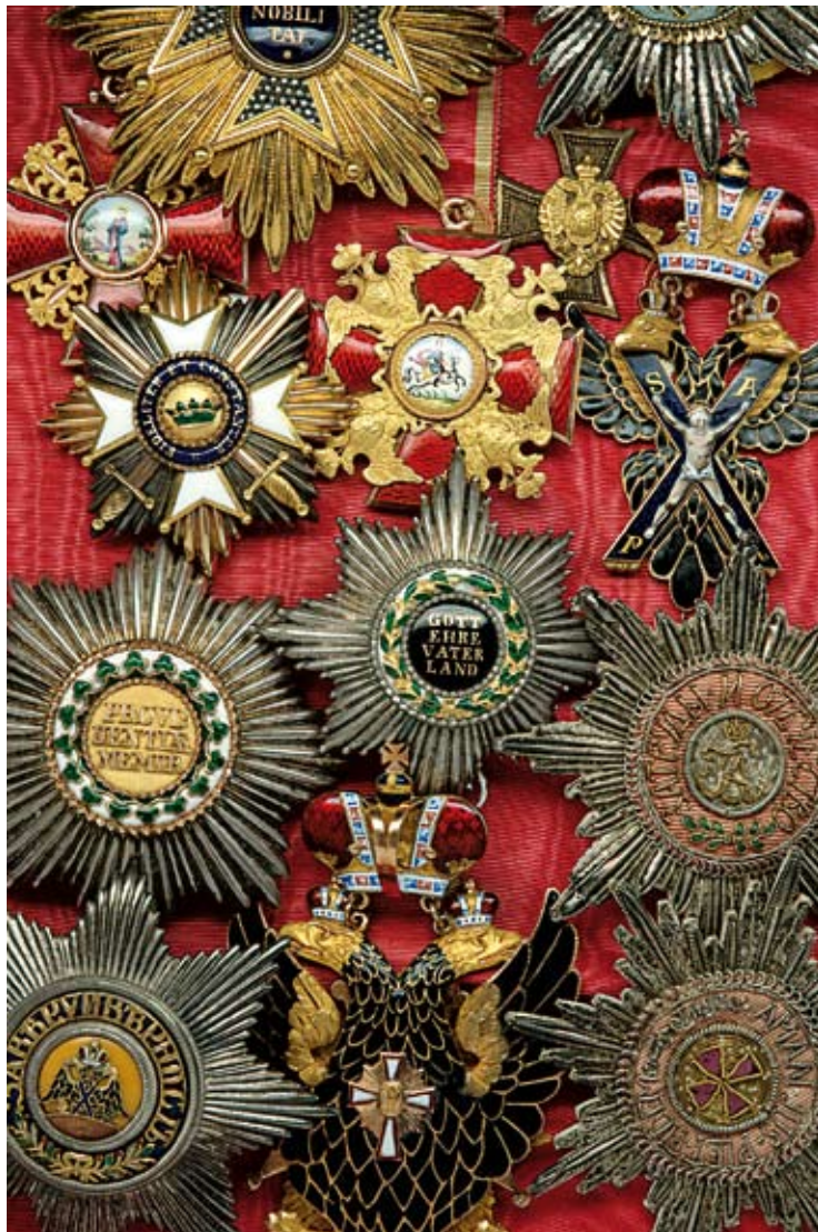
Welchen Reiz Orden ausüben, davon können Sie sich selbst überzeugen: Noch bis 11. April zeigt das Landesmuseum Joanneum im Münzkabinett des Schloss Eggenberg in einer Sonderausstellung die Orden seines Gründers: Erzherzog Johann, der Ausgezeichnete.

Das Große Goldene bekam weiland auch Formel-1-Zampano Bernie Ecclestone. Er vertuschste sich bald darauf mit dem GP-Zirkus aus Österreich.