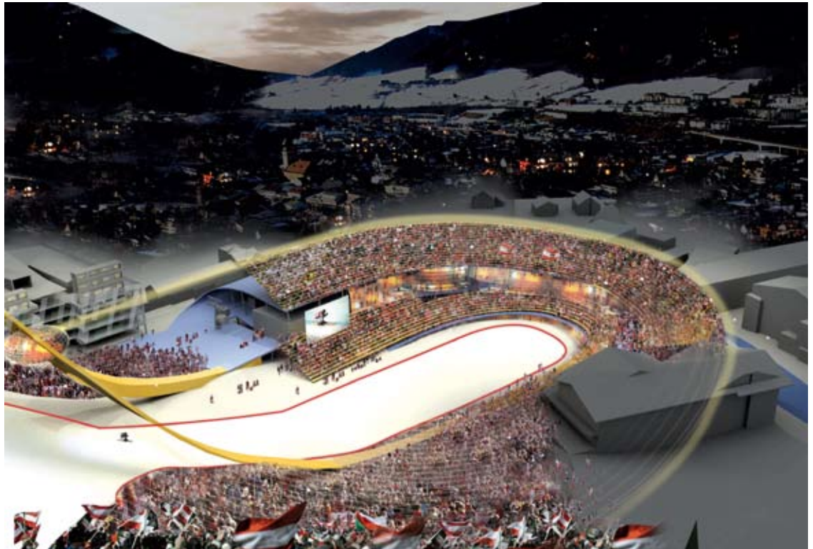
So soll die Schladming-Dachstein Tribüne bei der Ski-WM 2013 aussehen. Derzeit wird noch über die Finanzierung verhandelt.