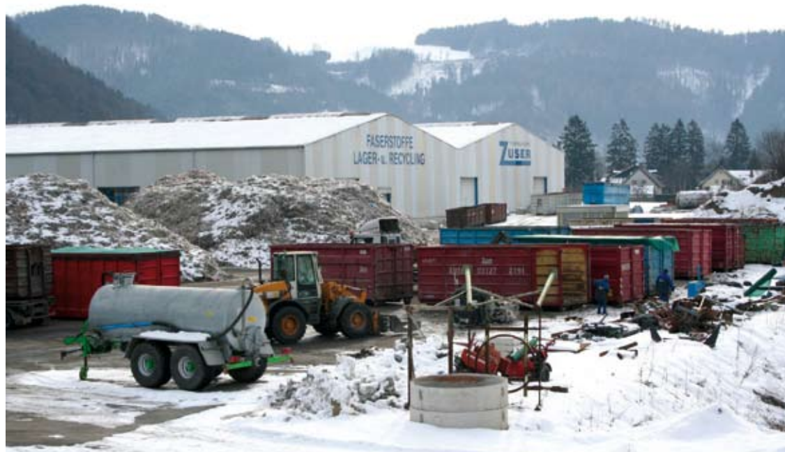
Nach der UEG-Peite ist es wichtig, dass die Müllentsorgung wieder in gemeinwirtschaftliche Hände kommt.

Die Firma Zuser führt auch die Müllentsorgung für die Gemeinde durch.