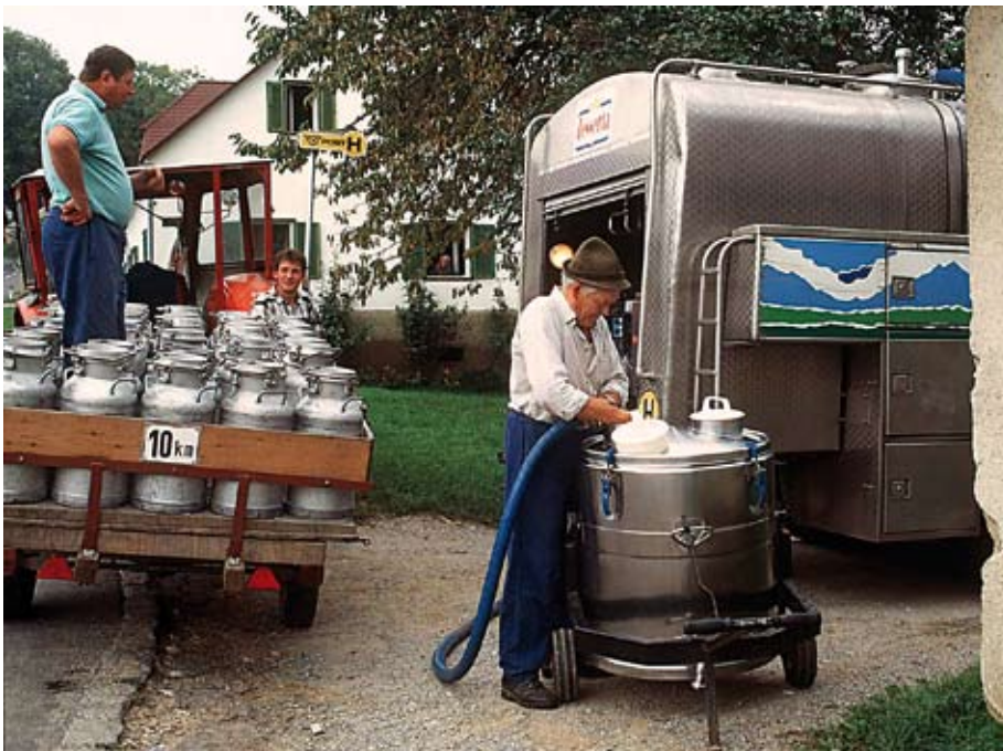
Die Abholung der Milch mit Milchkannen gehört längst vergangenen Zeiten an. Aus hygienischen Gründen, das schreibt die EU vor. Trotzdem kommen nun abenteuerliche Vorgänge ans Tageslicht: Eine Linzer Firma produziert in Hartberg Quargel aus holländischer und deutscher Milch, um für das nun österreichische Produkt am europäischen Markt Argarförderungen zu bekommen.

Prolactal selbst hat seine Gesellschaftertätigkeit bei TechforTaste indes ruhend gestellt. Schließlich sehe man sich gegenwärtig außerstande, „so aktiv und engagiert im Lebensmittelcluster mitzuarbeiten, wie es unseren Qualitätskriterien und Ansprüchen entspricht“, heißt es in einem Schreiben an die SFG vom 22. Februar.