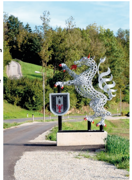
Von Christian Pirkl - Eigenes Werk, CC BY-SA 4.0, https://commons.wikimedia.org

Landeshauptmann Schützenhöfer geht in den wohlverdienten Ruhestand. Nach dem frühzeitigem Abgang von Kurz und Co. fragen sich viele wie es mit der ÖVP jetzt wohl weitergehen wird. Einstweilen hat man einen Nachfolger gefunden.